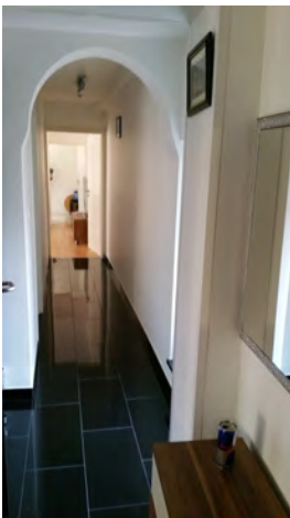
Eingangsbereich mit Granitboden